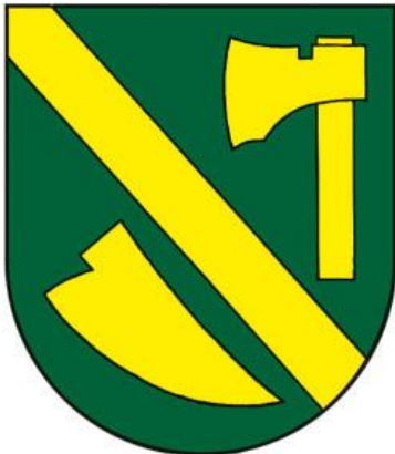
Príloha 1: erb obce